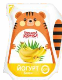
Йогурт с фруктовым наполнителем «Банан» 2,8 %