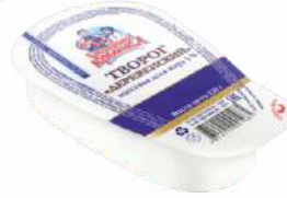
Творог 5 %