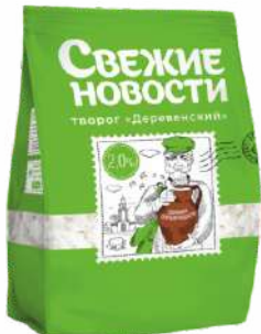
Творог 2 %