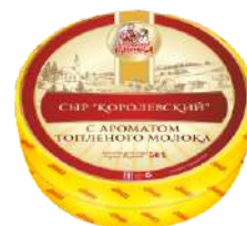
Сыр «Королевский» 50 %