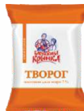
Творог 7 %