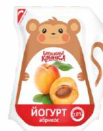
Йогурт с фруктовым наполнителем «Абрикос» 2,8 %