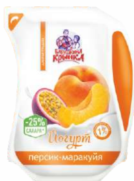
Йогурт с фруктовым наполнителем «Персик-маракуйя» 1 %