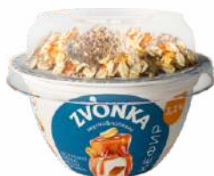
Кефир 3,2 % и смесь из мясли и фундука дробленого в карамели