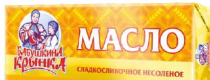
Масло сладкосливочное несоленое 82,5 %