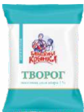
Творог 1 %