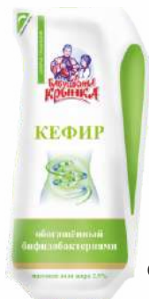
Кефир обогащенный бифидобактериями 2,5 %