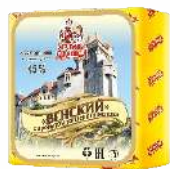
Сыр «Венский» с ароматом топленого молока 45 %