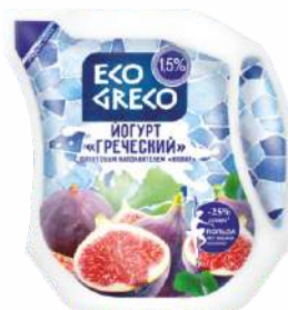
Йогурт «Греческий» с фруктовым наполнителем «Инжир» 1,5 %