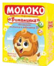
Молоко питьевое стерилизованное «Витаминка» обогащенное кальцием и витамином D3 (апликатор соломинка) 3,2 %