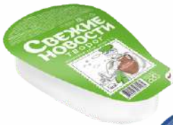
Творог 2,0 %