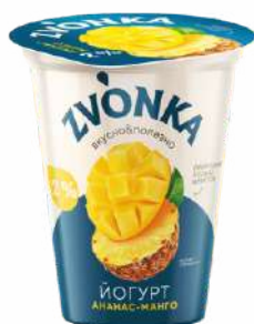
Йогурт с фруктовым наполнителем «Ананас-манго» 2 %