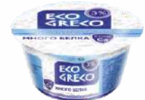
Творог зерненный «Домашний» со сливками 3 %