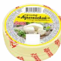
Сыр мягкий «Адыгейский» 45 %