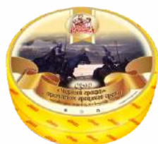
Сыр «Черный граф» с ароматом грецкого ореха 50 %