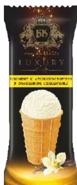
Мороженое пломбир с ароматом ванили в вафельном стаканчике 15 %, 70 г