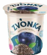
Йогурт двухслойный с фруктовым наполнителем «Черника-чиа» 2 %