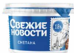
Сметана 18 %