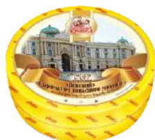
Сыр «Венский» с ароматом топленого молока 45 %