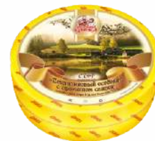
Сыр «Сметанковый особый» с ароматом сливок 50 %