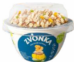
Кефир 3,2 % и смесь из мясли, цукатов из ананаса, семян подсолнечника и тыквы