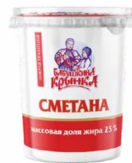
Сметана 25 %