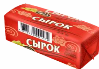
Сырок глазированный «Мак-изюм-бисквит» 23 %