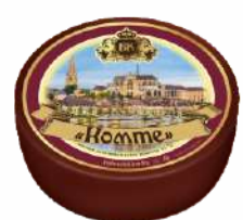
Сыр «Комте» 45 %