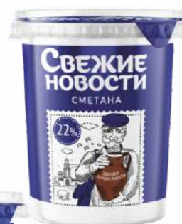
Сметана 22 %