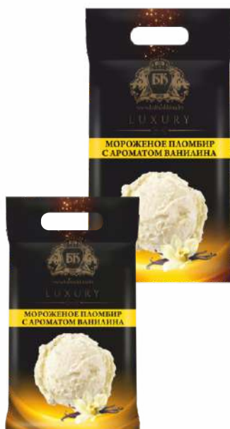
Мороженое пломбир с ароматом ванили 15 %