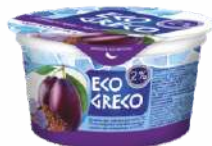
Йогурт с повышенным содержанием белка с наполнителем «Чернослив-лён» 2 %