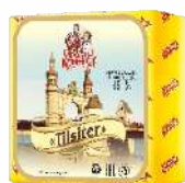
Сыр «Tilsiter» 45 %