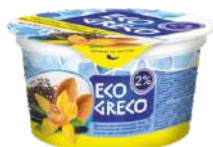
Йогурт с повышенным содержанием белка с наполнителем «Миндаль-ваниль-чиа» 2 %