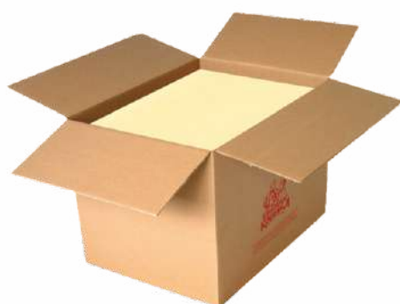
Масло сладкосливочное несоленое «Крестьянское» 72,5 %