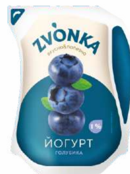
Йогурт с фруктовым наполнителем «Голубика» 1 %