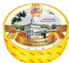
Сыр «Губернский» с ароматом топленого молока 45 %