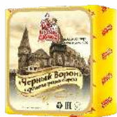
Сыр «Черный Ворон» с ароматом грецкого ореха 50 %