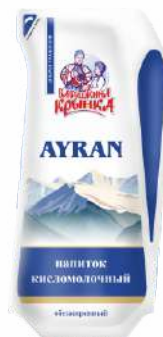
Напиток кисломолочный «AYRAN» обезжиренный