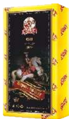
Сыр «Король Людвиг» с ароматом топленого молока 45 %