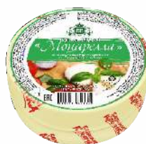
Сыр мягкий «Моцарелла» 45 %