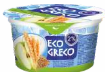
Йогурт с повышенным содержанием белка с наполнителем «Яблоко-злаки-семена льна» 2 %