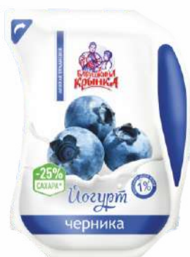
Йогурт с фруктовым наполнителем «Черника» 1 %