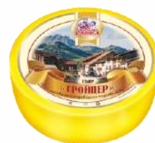
Сыр «Гройцер» 45 %