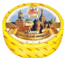
Сыр «Российский молодой» 50 %