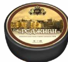
Сыр «Реджيان» 45 %