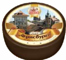
Сыр «Фрисбург» 45 %