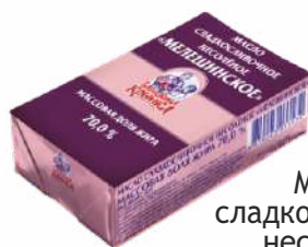
Масло сладкосливочное несоленое «Мелешинское» 70,0 %