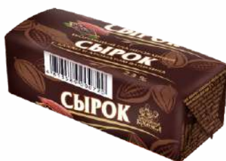
Сырок творожный глазированный с какао и ароматом ванили 23 %