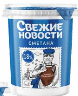
Сметана 18 %