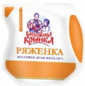
Ряженка 3,0 %