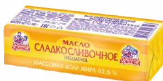
Масло сладкосливочное несоленое 82,5 %