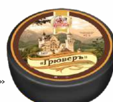
Сыр «Грювер» 45 %