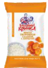
Масса творожная сладкая с курагой 4,5 %