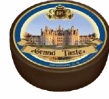
Сыр «Grand Taste» 50 %