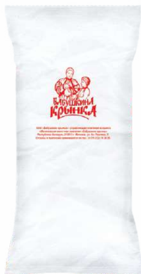
Сыворотка молочная сухая деминерализованная СД 50 1,0 %