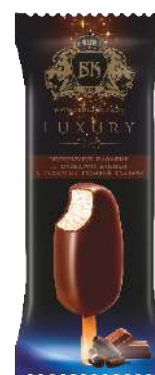
Мороженое пломбир с ароматом ванили в какао содержащей глазури на палочке 15 %, 60 г