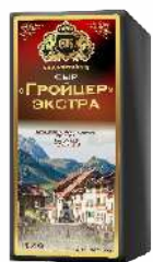
Сыр «Гройцер» экстра 50 %