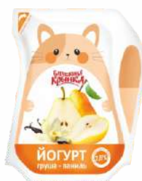
Йогурт с фруктовым наполнителем «Груша-ваниль» 2,8 %