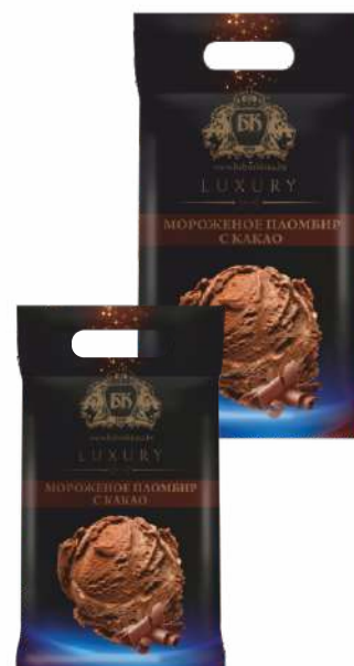
Мороженое пломбир с какао 15 %