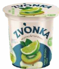
Йогурт двухслойный с фруктовым наполнителем «Киви-зеленое яблоко-лайм» 2 %