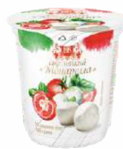
Сыр мягкий «Моцарелла» 45 %