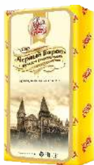
Сыр «Черный Ворон» с ароматом грецкого ореха 50 %