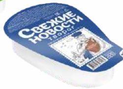
Творог 7,0 %