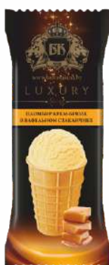
Мороженое пломбир крем-брюле в вафельном стаканчике 15 %, 70 г