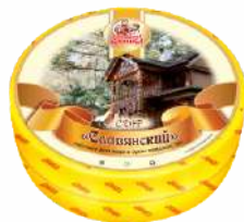
Сыр «Славянский» 50 %