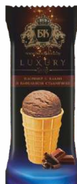
Мороженое пломбир с какао в вафельном стаканчике 15 %, 70 г