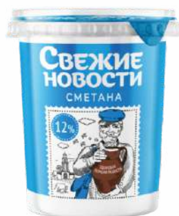
Сметана 12 %