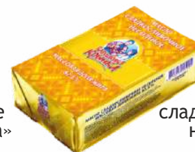
Масло сладкосливочное несоленое 82,5 %