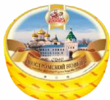
Сыр «Костромской Новый» 45 %