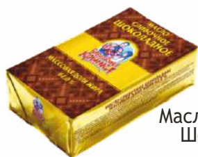
Масло сливочное Шоколадное 62,0 %