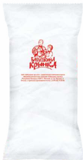
Пахта сухая 3,0 %