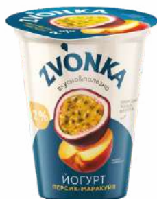
Йогурт с фруктовым наполнителем «Персик-маракуйя» 2 %