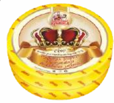
Сыр «Король Генрих» с ароматом топленого молока 50 %