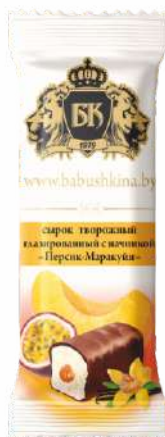
Сырок творожный глазированный с начинкой «Персик-Маракуйя» 23 %