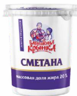
Сметана 20 %