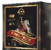
Сыр «Король Людвиг» с ароматом топленого молока 45 %