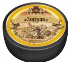
Сыр «Ларзак» 45 %