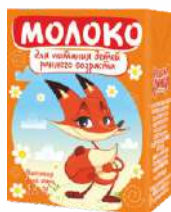
Молоко питьевое стерилизованное для питания детей раннего возраста (апликатор соломинка) 3,5 %