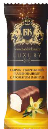
Сырок творожный глазированный с ароматом ванили 26 %