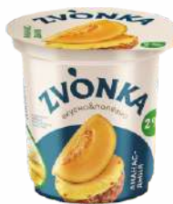
Йогурт двухслойный с фруктовым наполнителем «Ананас-дыня» 2 %