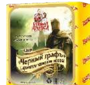
Сыр «Черный граф» с ароматом топленого молока 50 %