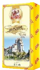
Сыр «Венский» с ароматом топленого молока 45 %