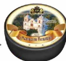
Сыр «Мстислав Великий» 50 %