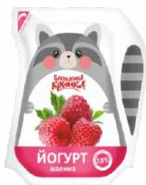
Йогурт с фруктовым наполнителем «Малина» 2,8 %