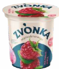
Йогурт двухслойный с фруктовым наполнителем «Малина-мята» 2 %