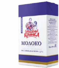
Молоко питьевое ультрапастеризованное 3,2 %