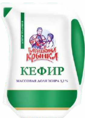
Кефир 3,2 %