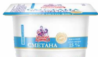
Сметана 15 %