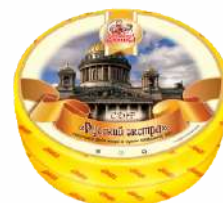
Сыр «Русский Экстра» 45 %