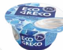
Йогурт «Греческий» 7 %