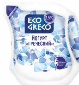
Йогурт «Греческий» 1,5 %