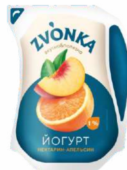
Йогурт с фруктовым наполнителем «Нектарин-апельсин» 1 %