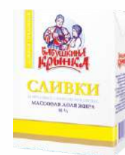
Сливки питьевые стерилизованные 10 %