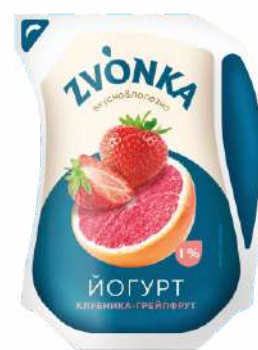
Йогурт с фруктовым наполнителем «Клубника-грейпфрут» 1 %