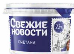
Сметана 22 %