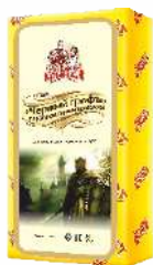
Сыр «Черный граф» с ароматом топленого молока 50 %