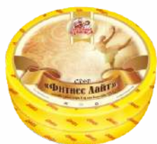
Сыр «Фитнес Лайт» 25 %