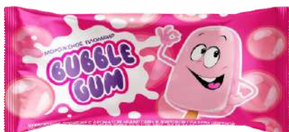
Мороженое пломбир с ароматом «Бабл гам» в жировой глазури цветной 12 %, 60 г