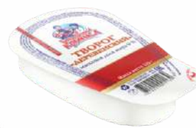
Творог 9 %