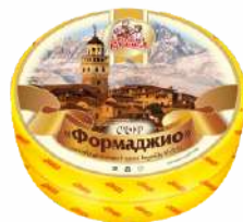
Сыр «Формаджио» 45 %