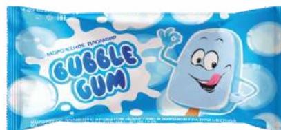
Мороженое пломбир с ароматом «Бабл гам» в жировой глазури цветной 12 %, 60 г