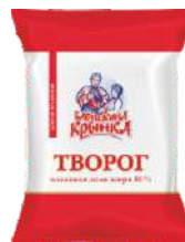
Творог 10 %