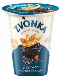
Йогурт с наполнителем «Чернослив-злаки» 2 %