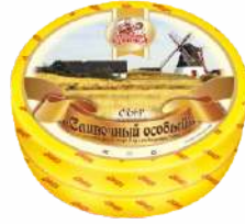
Сыр «Сливочный особый» 50 %