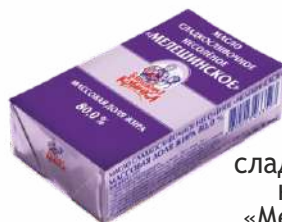
Масло сладкосливочное несоленое «Мелешинское» 80,0 %