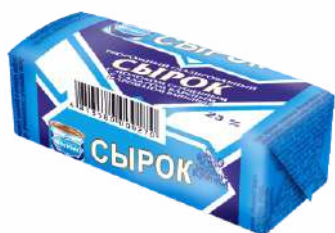
Сырок творожный глазированный с молоком сгущенным вареным с сахаром и ароматом ванили 23 %