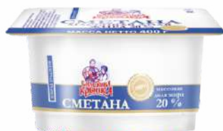
Сметана 20 %