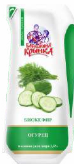
Биокефир с наполнителем «Огурец» 2,5 %