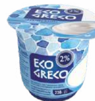
Йогурт «Греческий» 2 %