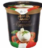
Сыр мягкий «Буррата» 45 %