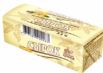
Сырок творожный глазированный с ароматом ванили 23 %