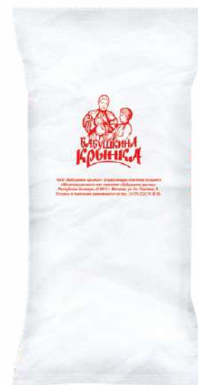
Молоко сухое цельное 26 %