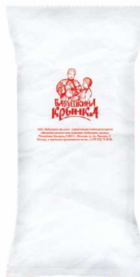
Молоко сухое обезжиренное 0,5 %