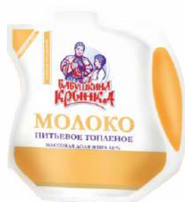
Молоко питьевое топленое 3,0 %