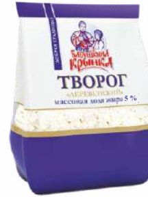
Творог 5 %