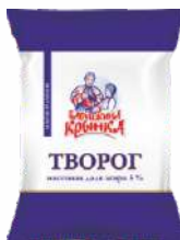
Творог 5 %