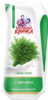
Биокефир с наполнителем «Укроп» 2,5 %