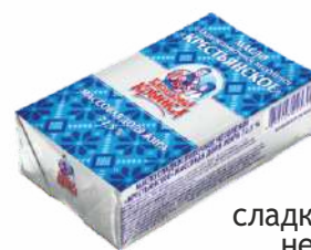
Масло сладкосливочное несоленое «Крестьянское» 72,5 %