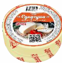
Сыр «Сулугуни» 45 %