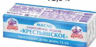
Масло сладкосливочное несоленое «Крестьянское» 72,5 %