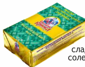
Масло сладкосливочное соленое «Росинка» 80,0 %