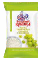
Масса творожная сладкая с изюмом 4,5 %