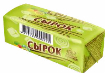
Сырок творожный глазированный с мармеладом и ароматом ванили 23 %