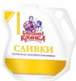
Сливки питьевые пастеризованные 10 %