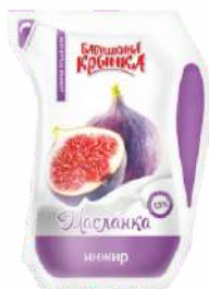
Бионапиток из пахты кисломолочный «Масланка» с фруктовым наполнителем «Инжир» 1,5 %