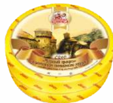
Сыр «Черный граф» с ароматом топленого молока 50 %