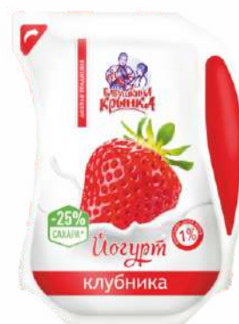
Йогурт с фруктовым наполнителем «Клубника» 1 %