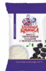
Масса творожная сладкая с черносливом 4,5 %