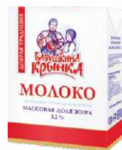
Молоко питьевое стерилизованное (апликатор соломинка) 3,2 %