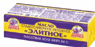
Масло сладкосливочное несоленое «Элитное» 84 %