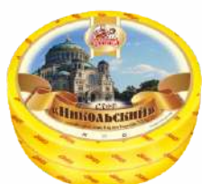
Сыр «Никольский» 50 %