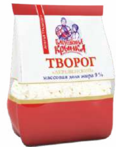
Творог 9 %