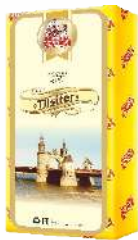
Сыр «Tilsiter» 45 %