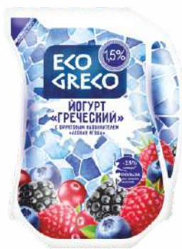
Йогурт «Греческий» с фруктовым наполнителем «Лесная ягода» 1,5 %