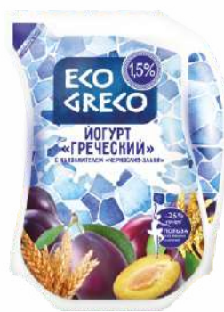
Йогурт «Греческий» с наполнителем «Чернослив-злаки» 1,5 %