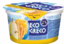
Йогурт с повышенным содержанием белка с фруктовым наполнителем «Груша-мёд-злаки» 2 %