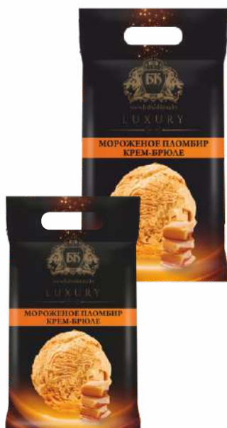
Мороженое пломбир крем-брюле 15 %