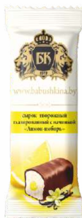
Сырок творожный глазированный с начинкой «Лимон-имбирь» 23 %