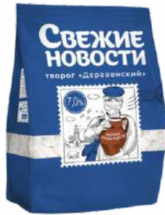
Творог 7 %