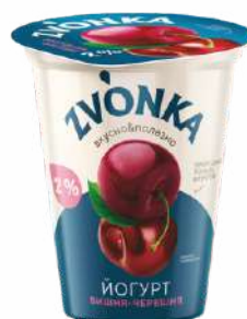
Йогурт с фруктовым наполнителем «Вишня-черешня» 2 %