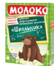
Молоко питьевое стерилизованное «Школьник» обогащенное инулином (апликатор соломинка) 3,2 %