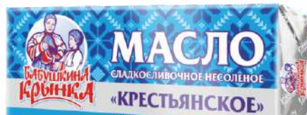
Масло сладкосливочное несоленое «Крестьянское» 72,5 %