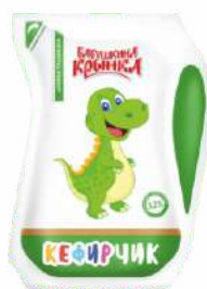
Кефир 3,2 %