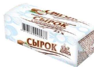
Сырок творожный глазированный с кокосовой стружкой и ароматом ванили 23 %