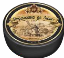
Сыр «Пармизано де Люкс» 45 %