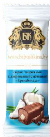
Сырок творожный глазированный с начинкой «КремаКолада» 23 %