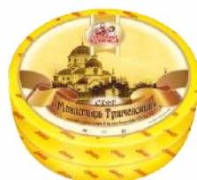
Сыр «Монастырь Тупичевский» 45 %