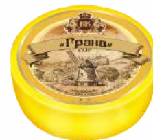
Сыр «Грана» 45 %