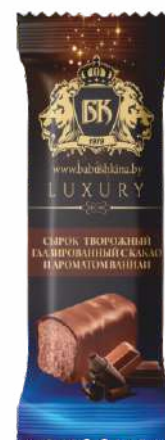
Сырок творожный глазированный с какао и ароматом ванили 26 %