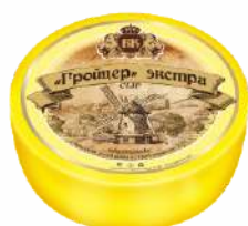
Сыр «Гройцер» Экстра» 50 %