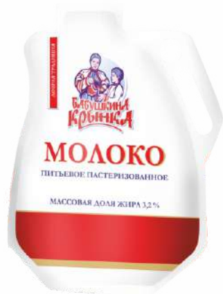
Молоко питьевые пастеризованные 3,2 %