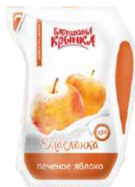
Бионапиток из пахты кисломолочный «Масланка» с фруктовым наполнителем «Печеное яблоко» 1,5 %